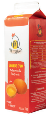
Cartonada 1kg Validade: 30 dias Caixa: 12 unidades (12Kg)