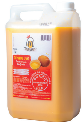
Galão 5kg Validade: 30 dias Venda unitária