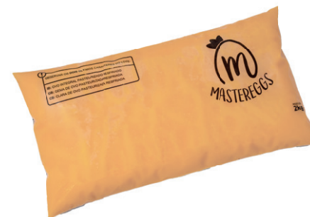
Bag 2kg Validade: 30 dias Caixa: 6 unidades (12kg)