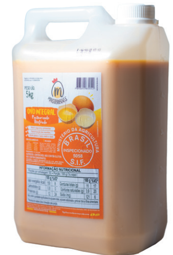
Galão 5kg Validade: 30 dias Venda unitária