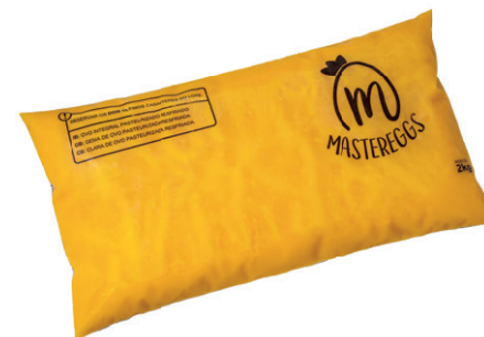
Bag 2kg Validade: 30 dias Caixa: 6 unidades (12kg)