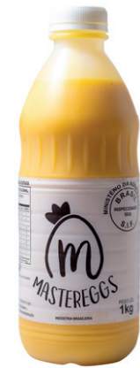
Pet 1kg Validade: 30 dias Caixa: 12 unidades (12Kg)