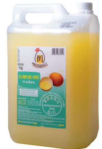
Galão 5kg Validade: 30 dias Venda unitária