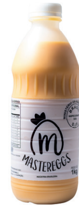
Pet 1kg Validade: 30 dias Caixa: 12 unidades (12Kg)