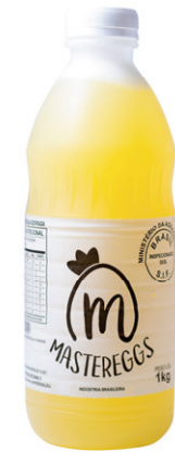
Pet 1kg Validade: 45 dias Caixa: 12 unidades (12Kg)