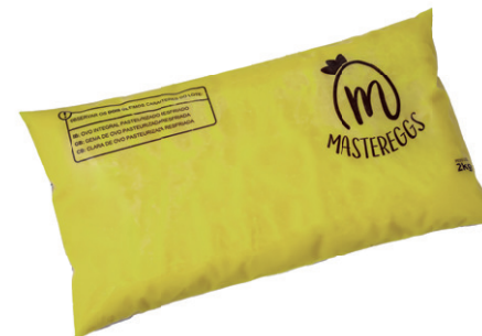
Bag 2kg Validade: 45 dias Caixa: 6 unidades (12kg)