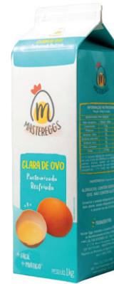
Cartonada 1kg Validade: 45 dias Caixa: 12 unidades (12Kg)