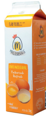
Cartonada 1kg Validade: 30 dias Caixa: 12 unidades (12Kg)